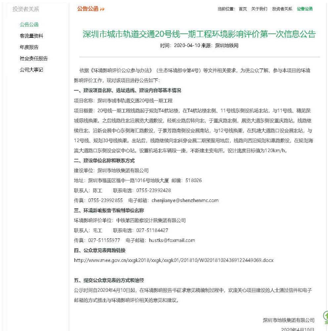
图 2.2-1 首次信息公开网络截图

公众意见表格式采用《关于发布〈环境影响评价公众参与办法〉配套文件的公告》（生态环境部公告 2018 年第 48 号）的规定格式，见下表所示。